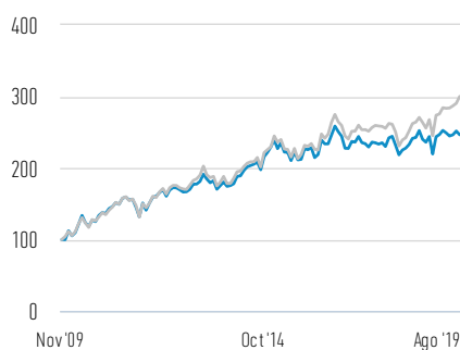
Rentabilidad de 100 USD invertidos desde el lanzamiento (valor en efectivo)

— Clase Z Acciones — FTSE Nareit Equity REITs (Net) Index