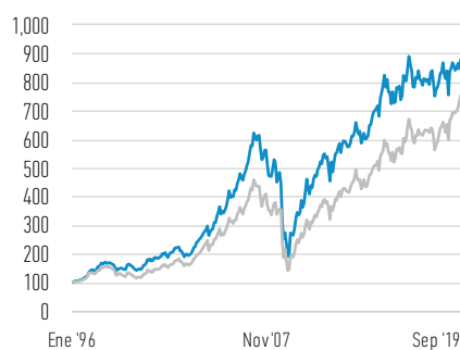
Rentabilidad de 100 USD invertidos desde el lanzamiento (valor en efectivo)

— Clase I Acciones — FTSE Nareit Equity REITs (Net) Index