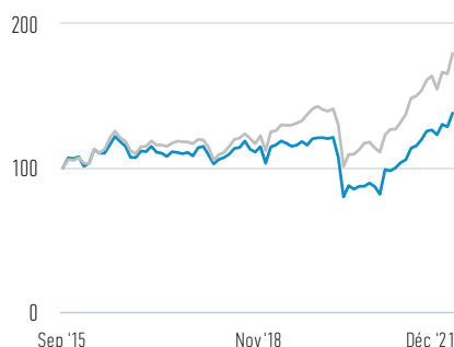
Performance de 100 USD investis depuis le lancement (valeur de rachat)