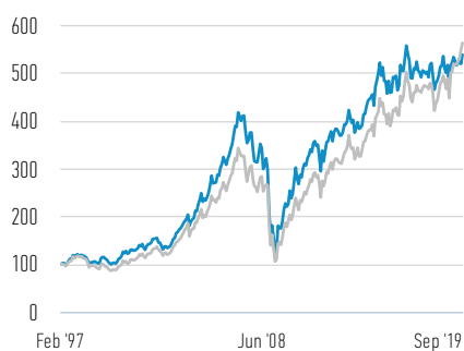
Rentabilidad de 100 USD invertidos desde el lanzamiento (valor en efectivo)

— Clase A Acciones — FTSE Nareit Equity REITs (Net) Index