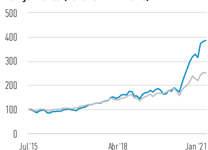
Desempenho de 100 USD Investidos desde o Lançamento (Valor em Dinheiro)

— Classe ZX Ações — Russell 1000 Growth Net 30% Withholding Tax TR Index