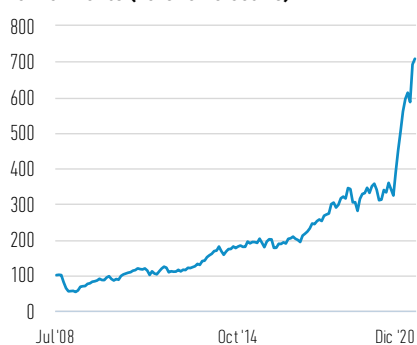
Rentabilidad de 100 EUR invertidos desde el lanzamiento (valor en efectivo)