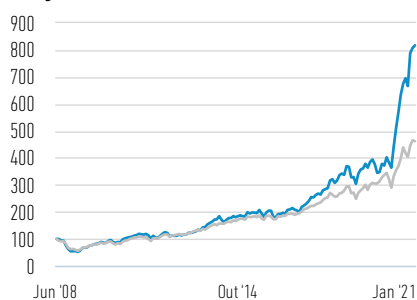
Desempenho de 100 USD Investidos desde o Lançamento (Valor em Dinheiro)

— Classe Z Ações — Russell 1000 Growth Net 30% Withholding Tax TR Index