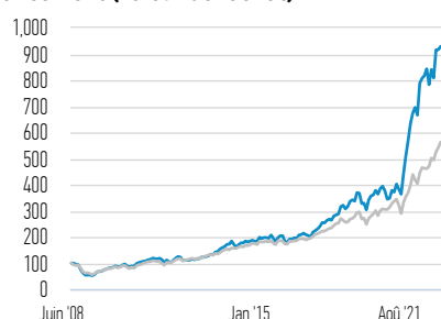
Performance de 100 USD investis depuis le lancement (valeur de rachat)

— Classe Z Parts — Russell 1000 Growth Net 30% Withholding Tax TR Index