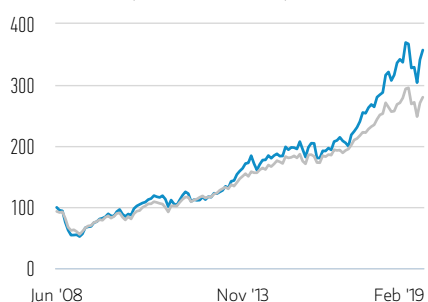
Rentabilidad de 100 USD invertidos desde el lanzamiento (valor en efectivo)

— Clase Z Acciones — Russell 1000 Growth Net 30% Withholding Tax TR Index