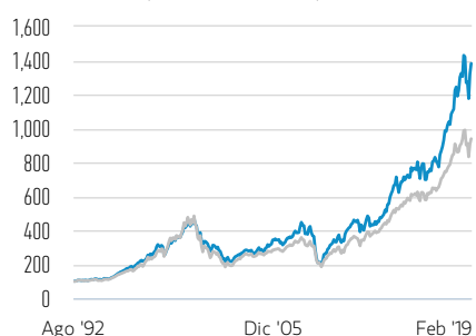
Rentabilidad de 100 USD invertidos desde el lanzamiento (valor en efectivo)

— Clase I Acciones — Russell 1000 Growth Net 30% Withholding Tax TR Index