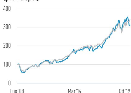
Performance di USD 100 investiti dal lancio (prezzo spot)

— Azioni di Classe C — Russell 1000 Growth Net 30% Withholding Tax TR Index