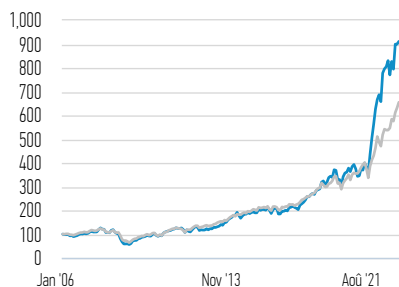
Performance de 100 USD investis depuis le lancement (valeur de rachat)

— Classe AX Parts — Russell 1000 Growth Net 30% Withholding Tax TR Index