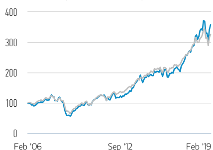
Rentabilidad de 100 USD invertidos desde el lanzamiento (valor en efectivo)

— Clase AX Acciones — Russell 1000 Growth Net 30% Withholding Tax TR Index