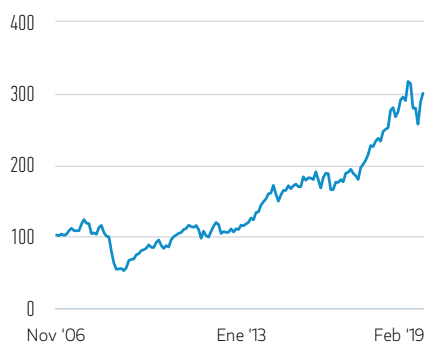
Rentabilidad de 100 EUR invertidos desde el lanzamiento (valor en efectivo)