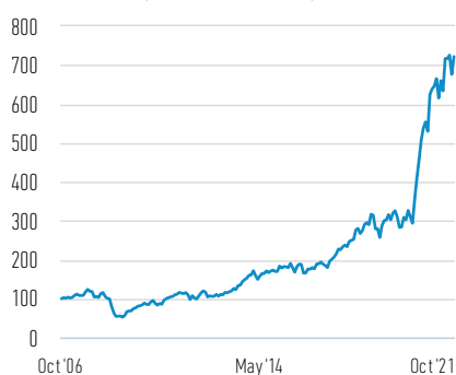
Rentabilidad de 100 EUR invertidos desde el lanzamiento (valor en efectivo)