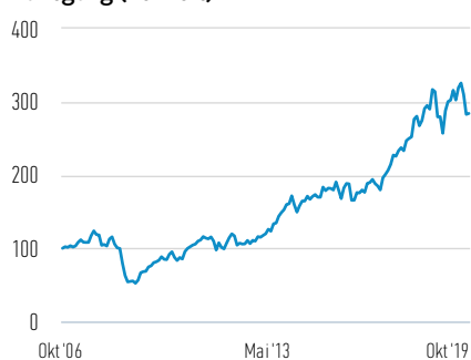
Wertentwicklung einer Anlage von 100 EUR seit Auflegung (Barwert)

— Anteile der AH (EUR)-Klasse (vor Abzug des maximalen Ausgabeaufschlags)