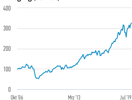
Wertentwicklung einer Anlage von 100 EUR seit Auflegung (Barwert)

— Anteile der AH (EUR)-Klasse (vor Abzug des maximalen Ausgabeaufschlags)