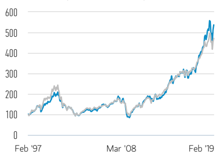
Rentabilidad de 100 USD invertidos desde el lanzamiento (valor en efectivo)

— Clase A Acciones — Russell 1000 Growth Net 30% Withholding Tax TR Index