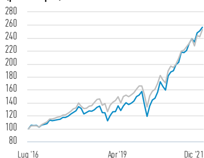
Performance di USD 100 investiti dal lancio (prezzo spot)

— Azioni di Classe Z — S&P 500 Total Return Index