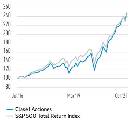
Rentabilidad de 100 USD invertidos desde el lanzamiento (valor en efectivo)