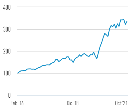
Rentabilidad de 100 EUR invertidos desde el lanzamiento (valor en efectivo)