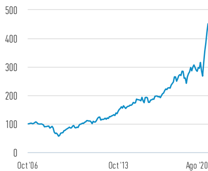
Rentabilidad de 100 EUR invertidos desde el lanzamiento (valor en efectivo)