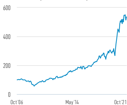
Rentabilidad de 100 EUR invertidos desde el lanzamiento (valor en efectivo)