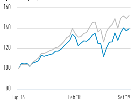
Performance di USD 100 investiti dal lancio (prezzo spot)

— Azioni di Classe Z — S&P 500 Total Return Index