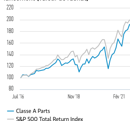
Performance de 100 USD investis depuis le lancement (valeur de rachat)