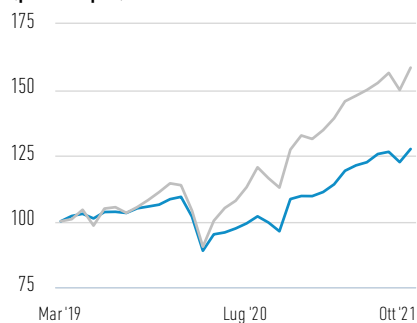
Performance di USD 100 investiti dal lancio (prezzo spot)