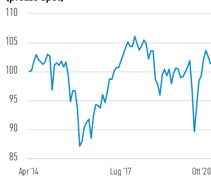
Performance di EUR 100 investiti dal lancio (prezzo spot)