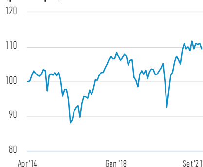
Performance di EUR 100 investiti dal lancio (prezzo spot)