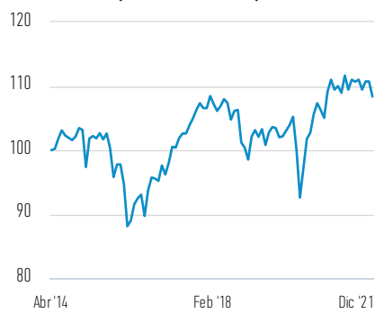
Rentabilidad de 100 EUR invertidos desde el lanzamiento (valor en efectivo)