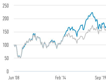
Rentabilidad de 100 USD invertidos desde el lanzamiento (valor en efectivo)

— Clase Z Acciones — MSCI India (Net) Index