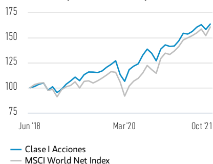
Rentabilidad de 100 USD invertidos desde el lanzamiento (valor en efectivo)