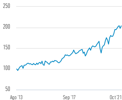
Rentabilidad de 100 EUR invertidos desde el lanzamiento (valor en efectivo)