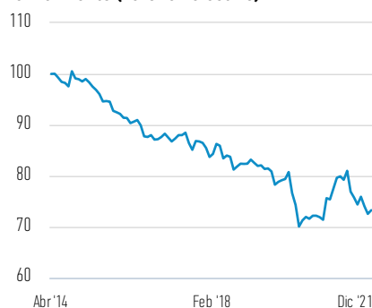
Rentabilidad de 100 EUR invertidos desde el lanzamiento (valor en efectivo)