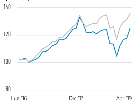
Performance di USD 100 investiti dal lancio (prezzo spot)

— Azioni di Classe Z — MSCI World Net Index