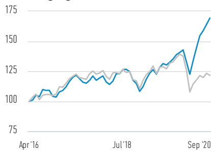
Wertentwicklung einer Anlage von 100 EUR seit Auflegung (Barwert)

— Anteile der I-Klasse — MSCI Europe Index