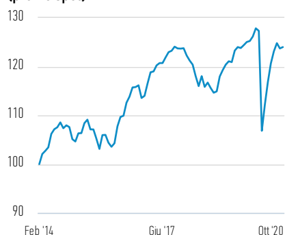
Performance di EUR 100 investiti dal lancio (prezzo spot)