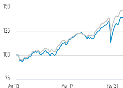
Performance de 100 USD investis depuis le lancement (valeur de rachat)

— Classe I Parts — JPM Corporate Emerging Markets Bond Index-Broad Diversified Index