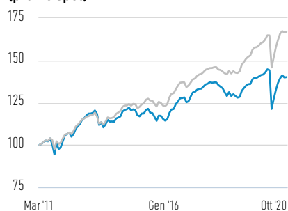
Performance di USD 100 investiti dal lancio (prezzo spot)

— Azioni di Classe B — JPM Corporate Emerging Markets Bond Index-Broad Diversified Index