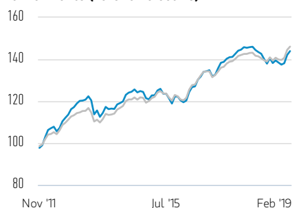
Rentabilidad de 100 USD invertidos desde el lanzamiento (valor en efectivo)

— Clase AX Acciones — JPM Corporate Emerging Markets Bond Index-Broad Diversified Index