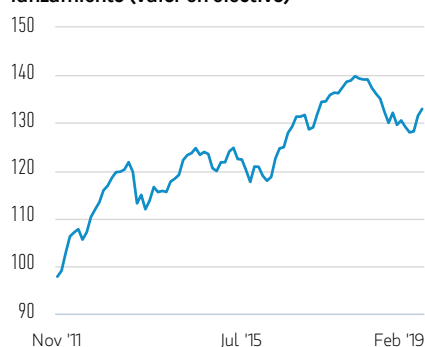
Rentabilidad de 100 EUR invertidos desde el lanzamiento (valor en efectivo)