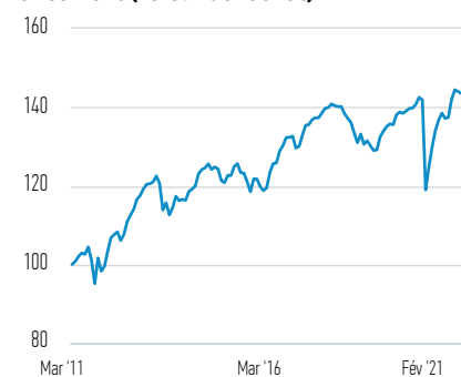
Performance de 100 EUR investis depuis le lancement (valeur de rachat)