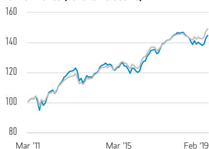
Rentabilidad de 100 USD invertidos desde el lanzamiento (valor en efectivo)

— Clase A Acciones — JPM Corporate Emerging Markets Bond Index-Broad Diversified Index