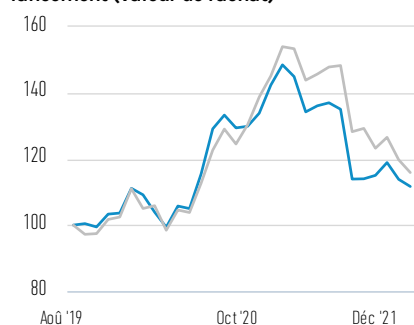
Performance de 100 USD investis depuis le lancement (valeur de rachat)