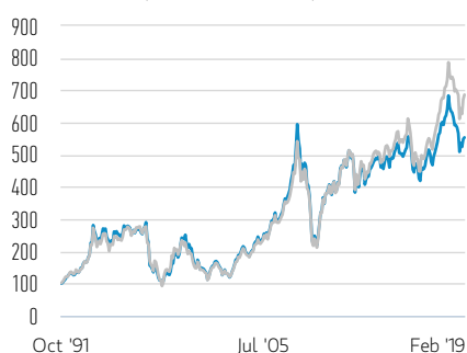
Rentabilidad de 100 USD invertidos desde el lanzamiento (valor en efectivo)