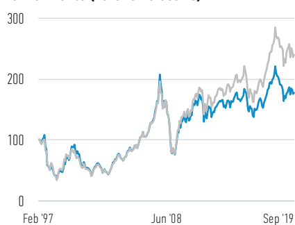
Rentabilidad de 100 USD invertidos desde el lanzamiento (valor en efectivo)