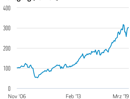
Wertentwicklung einer Anlage von 100 EUR seit Auflegung (Barwert)

— Anteile der AH (EUR)-Klasse (vor Abzug des maximalen Ausgabeaufschlags)